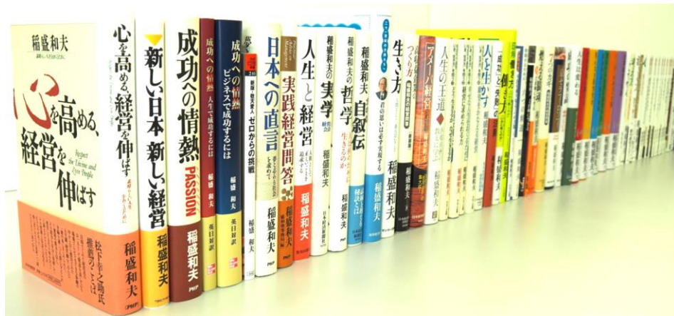
Collection de livres du Dr. Kazuo Inamori, fondateur de Kyocera