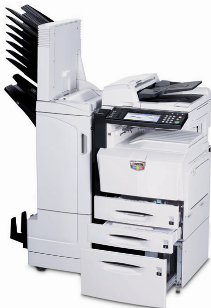
Photo: KM-C4035E avec des options gestion du papier.

Kyocera étend et renouvelle sa gamme de multifonctions couleur pour mieux répondre aux exigences des entreprises en termes de productivité, de qualité et de fiabilité. Les nouveaux modèles KM-C2525E, KM-C3232E et KM-C4035E copient, impriment et numérisent en couleur en offrant 3 nouvelles fonctionnalités en standard : le cryptage et la compression des PDF ainsi que la fonction « scan to SMB ». La convivialité et l'efficacité d'utilisation sont toujours au rendez-vous pour la plus grande satisfaction des utilisateurs.