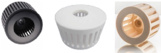
Illustration 1 : Classificateurs en Nitrure de silicium et en alumine pour le broyage.