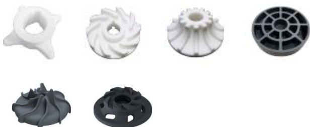
Illustration 2 : Rotors oxydés et non-oxydés pour le mélange.