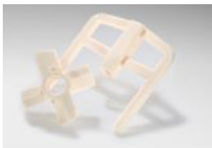
Illustration 5 : Pièces en alumine.

Liens où consulter les propriétés des matériaux :