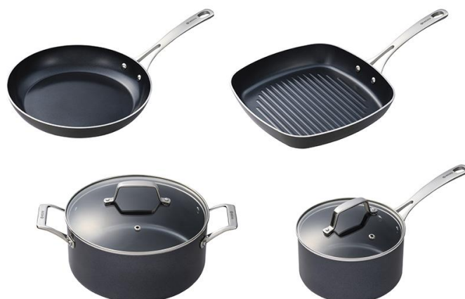
Modèles CFP-L10, CGP-10, CSP-07 et CSTP-09

Pour plus d'informations sur Kyocera : www.kyocera.fr